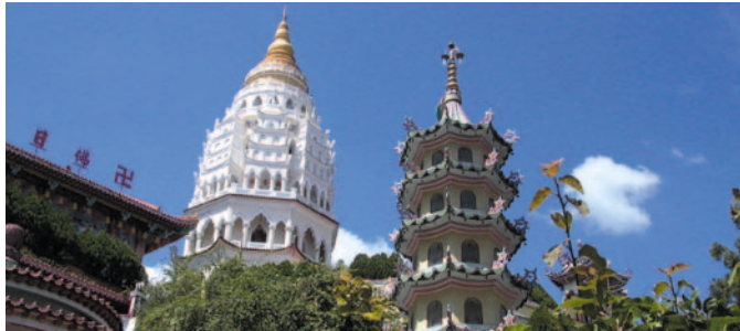
馬來西亞 - 檳城

有東方之珠美譽的檳城，魅力源自如詩如畫的風光：富有歐洲風格的殖民時代建築，不同教派歷史久遠的朝聖地及陽光充沛的熱情沙灘，還有叫人讚口不絕的檳城地道美食，其中融匯了不同民族琳瑯滿目的傳統小吃，更是老饕不容錯過的特色料理。